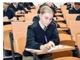
Allievi ufficiali durante una lezione universitaria